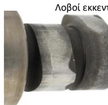
Λοβοί εκκεντροφόρου άξονα